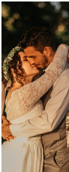
Fotógrafo de matrimonios