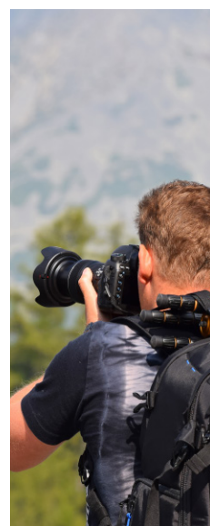
Y mucho más...