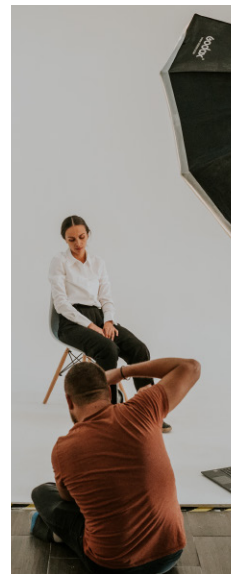
Fotógrafo de estudio