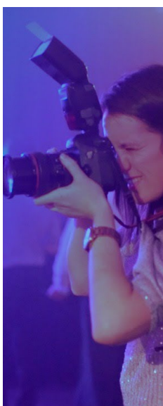
Fotógrafo de eventos