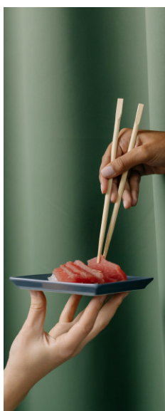
Fotógrafo de producto